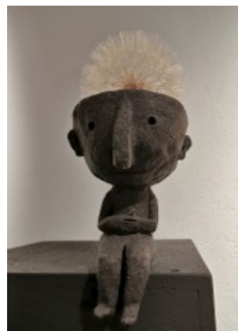
Pissenlit de Christian Voltz

Nous avons à cœur de proposer à nouveau ce grand rendez-vous de qualité mettant en avant toute la chaîne du livre. Le monde du livre, de la culture en général, aura besoin du soutien de tous·tes, partenaires et financeurs, pour à nouveau continuer cette mission.