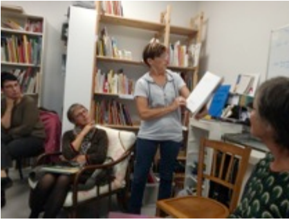
Entraînement à la lecture à haute voix entre lecteur·rices.

Cette semaine de lectures impromptues est très appréciée, aussi bien par les enseignant·es, les élèves que par les lecteur·rices. Les livres des invité·es sont privilégiés, mais aussi d'autres, des nouveautés, des classiques, des albums en lien avec le thème... Ils suscitent beaucoup d'intérêt de la part des enfants, habitués chaque année à recevoir les lecteur·rices à cette période et ravis de se remémorer la visite d'un invité·e les années passées ou curieux de savoir qui viendra dans leur classe en 2020... L'affiche du 35 e Salon du Livre est offerte aux classes à l'issue des lectures, celle-ci interpelle et crée beaucoup d'enthousiasme.